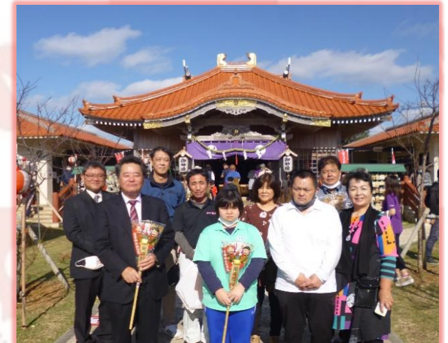
祈禱式後の記念撮影