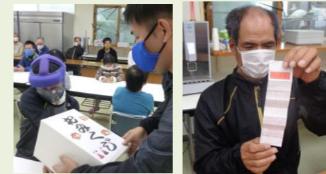
絵馬にお願い書きました