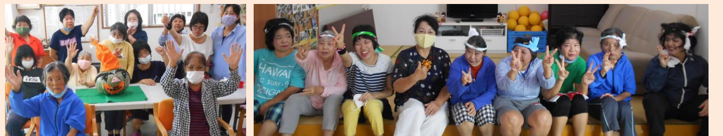
↑巨大なんこうカボチャもハロウィン仕様。この後グループホームで美味しくいただきました！