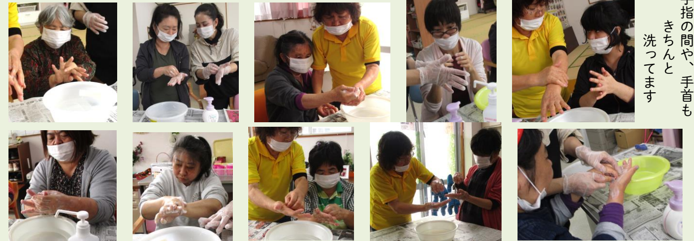
手指の間や、手首も きちんと 洗ってまます

生活介護では毎日①バイタルチェック②マスク着用③テーブル・ソファ・ドアノブ・椅子等の消毒(総合除菌消臭水を希薄したもので拭き上げ)④うがい・手洗い・アルコール消毒の徹底(声掛け促し)をしています。今回、改めて共通認識をもち今後とも事業所で習慣化し活用していきたいと思えました。