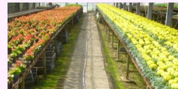
ハウス内で大切に育てられた花々