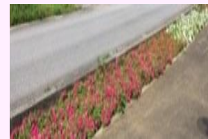
城辺 比嘉ロードパーク