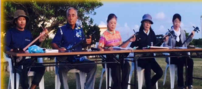
山中自治会の皆さんが三線を披露してくれました