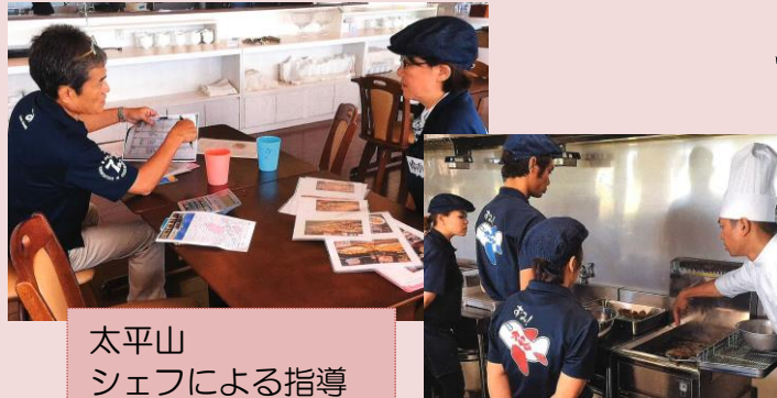
太平山 シェフによる指導

内閣府沖縄総合事務局が窓口になっている農山漁村振興交付金 農福連携事業を活用し平成30年度において野菜ランドみやこの苗テラスのLED化と㈱アメニティ(だいこんの花)と提携しレストラン太平山の技術及びメニュー指導、各種作業マニュアルの構築、そして現場視察など行いました。これにより課題となっていた苗テラス内の温度上昇を抑える事ができ節電が可能となり、より一層生産力のアップに繋がるようにしていきたいと思ひます。またその野菜を活用しているレストランにおいても本格的なシェフの指導の基、接客、店内レイアウト、メニューの考案、料理の技術指導などを受けたことにより、よりスムーズに業務ができるようになってきました。この事業はこれで終わりではなくこれで整備したものを基に更に改善し各部門頑張っていきたいと思ひます。ご協力していただきました関係機関に感謝です。