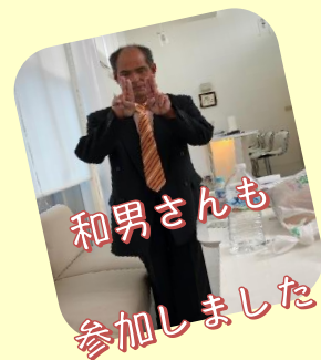
和男さんも 参加しました

3/9(土)は朝から早めに起きてちょっとした私服に着がえライカムへ。それぞれの買い物をしました。その後、9名で昼食をとりました。その夜、何と僕の同級生と会いました。GH大会の会場ではいろんな方と会うことができました。そんな感じで何ごともなく9名で楽しむことができました。