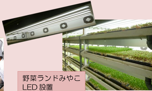
野菜ランドみやこ LED 設置