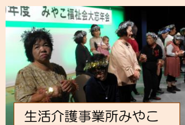
生活介護事業所みやこ