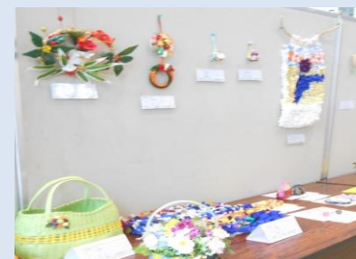
作品展にて生活介護の作品