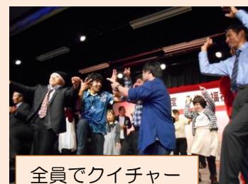
全員でクイチャー