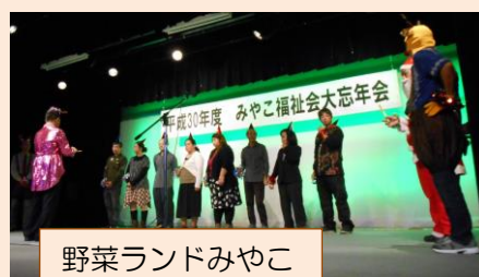
野菜ランドみやこ