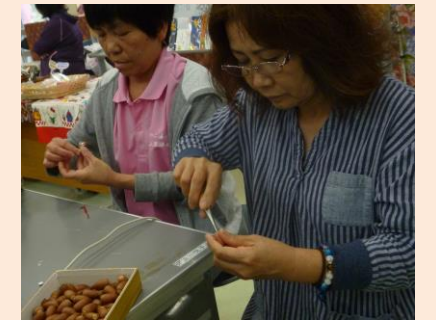
左から：エイサー隊のオープニング・なかぼつ「缶バッチ作り」・生活介護体験コーナー「どんぐりストラップ作り」