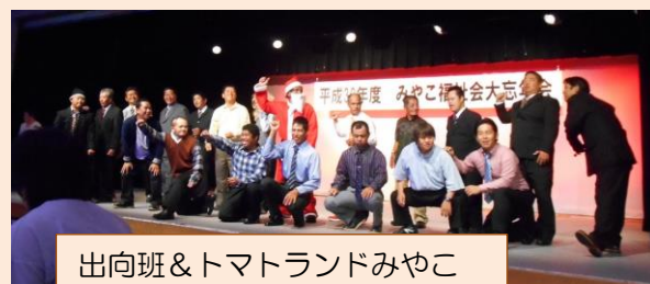
出向班&トマトランドみやこ