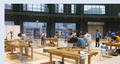
宮古特別支援学校から木工で出場