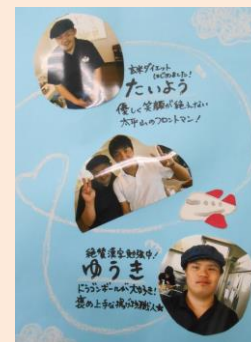
写真左から：太平山のスタッフ紹介ポスター・ころころシリーズのおにぎり・つなぎパンの試食・お気持ちカードとシェルキャンドル

どの班の提案も人と人の関わりを重要視しており、今後の当法人の活動にとってもよい気付きをいただき充実した研究成果発表会となりました。SFC 玉村研究会のメンバーの取組みやそれにご協力いただいた地域の方々、皆様のご協力で出来上がった成果発表会、本当に感謝の気持ちでいっぱいです。ありがとうございました。