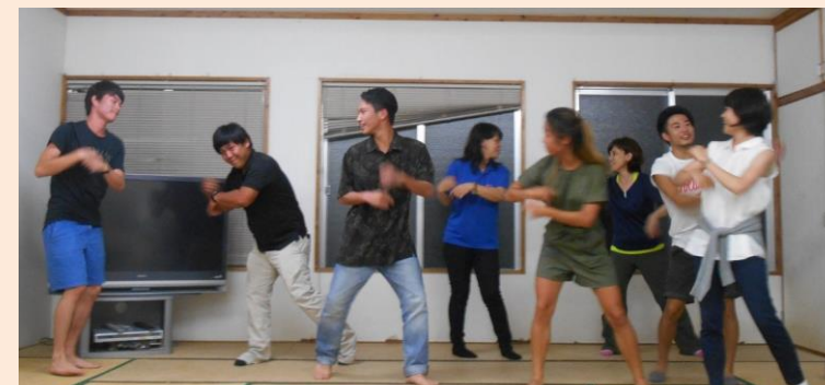
発表会後の懇親会にて、学生さんと職員と一緒にダンス♪