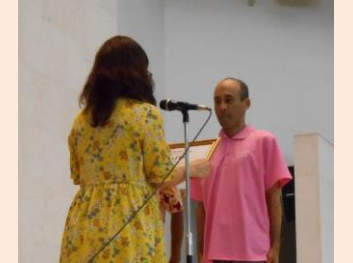
マハロ賞を頂きました