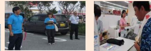
上左：出発式 下右：自由時間 (マクドナルド)

5月11日（金）の午後、「母の日」にちなみ、毎年恒例となっている買い物支援が行われました。サンキ駐車場で出発式を行った後、目的の商品を求め市内の店舗（サンキ・しまむら・ドン・キホーテ・サンエー）や、お花で気持ちを伝えたいという要望に答え新たに「花屋」も加え買い物を楽しみました。事前に目的の商品を決めてきた方、当日どれにしようかと一生懸命に悩む方、自分へのご褒美を選ぶ方、普段と違う利用者さんの表情や想いを感じ取る事ができた時間でした。その想いはプレゼントを貰う方にも届いた事でしょう♡ 買い物後は自由時間を楽しみ、リフレッシュにも繋がったのではないかと思います。ケガや事故なく楽しく買い物ができたのも、参加したみなさんやご協力頂いた各店舗の皆様のおかげです。ありがとうございました。