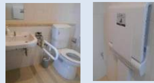
トイレは車いす対応 おむつ交換台もあります