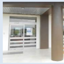
アダナス入口&販売コーナー