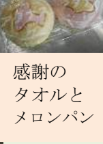
感謝の タオルと メロンパン