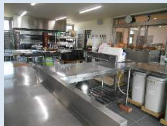
厨房 パンの成型・焼成