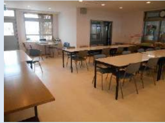
ホール パン包装など