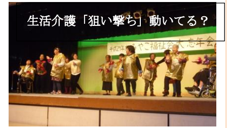
生活介護「狙い撃ち」動いてる?