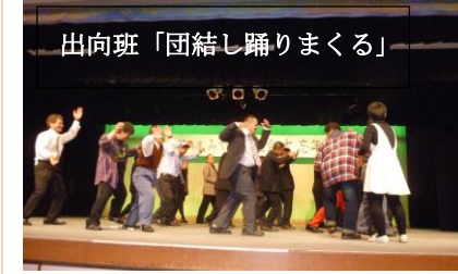
出向班「団結し踊りまくる」