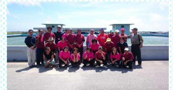
大きな貯水槽前で記念撮影