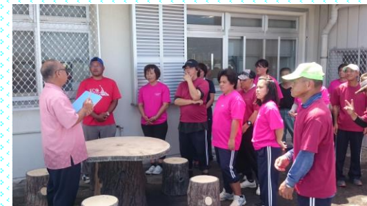
職員の方からお話を聞きました

去った6月7日、野菜ランドみやこ、トマトランドみやこのメンバーで「6月の水道月間」にちなみ袖山浄水場の見学に行ってきました。毎日、野菜の配達で袖山浄水場の前を通りますが、見学するのは初めてでとても参考になりました。袖山浄水場では宮古島の九つの水源地より水を吸い上げ、水を浄化し硬度を下げ、平良、池間、伊良部地区に美味しい水を届けているそうです。袖山浄水場の中には小さな池があり鯉が飼育されています。まず水源地の吸い上げられた水がこの池に注がれます。それで鯉に異常があれば水が汚染されているということで給水はストップするそうです。野菜ランドみやこでは水道水にて葉野菜の水耕栽培を行っています。今後とも、水に