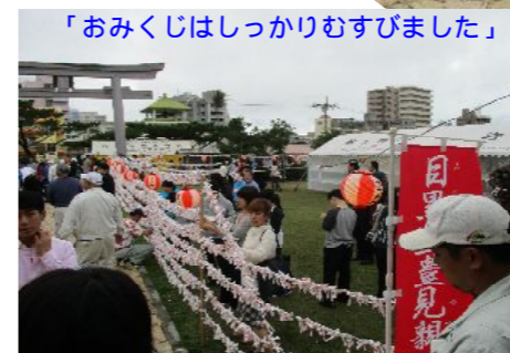
「おみくじはしっかりむずびました」