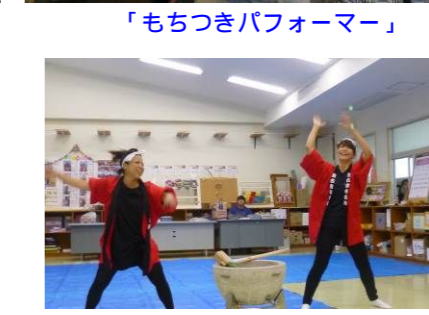
「もちつきパフォーマー」