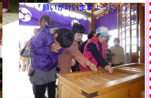
「願いが叶いますように!」