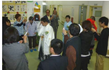
「主役のお二人さん入場」