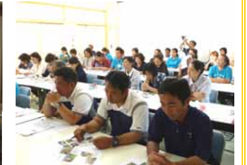
「職員も真剣な面持ちで傾聴」