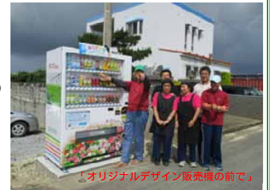
「オリジナルデザイン販売機の前で」

野菜ランドみやこの入口に暑い夏のお助けマシン！自動販売機が4/17(金)に設置されました。これは日本財団さんが推進している「夢の貯金箱」と呼ばれるもので1本ジュースを購入していただくと10円社会貢献事業(いじめ自殺対策事業、難病や犯罪被害者支援等々)へ寄付する仕組みとなっており全国でも現在約2,000台設置されています。日本財団さんとは10人乗りの(車椅子対応車)車両の寄付を頂いたのが縁で今回の設置となりました。販売機のデザインもオリジナルデザインでみやこ学園の園芸班の花を正面に側面には野菜ランドみやこのハウス内の写真を掲載しており日本に1つしかないデザインです。これから暑い夏がきます。是非皆様、のどがかわいた、またこころのちょっとした安らぎに夢の貯金箱をご活用くださいますようお願いいたします^^