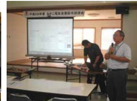
「支援課長より事業説明」