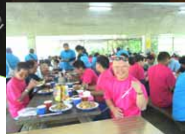
「直樹さん！たべようか〜」