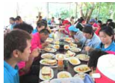
「レストラン成美？・・・」