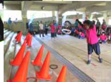
「秀人さん入ったね。ばんざーい」