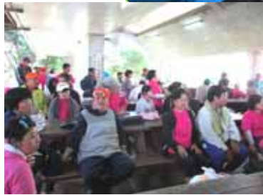
各班で準備「何を作るのかな？」