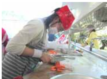
「美幸さん慣れた手つきだね」