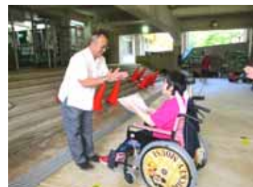
「輪投げ優勝はアダナスと那城班でした」