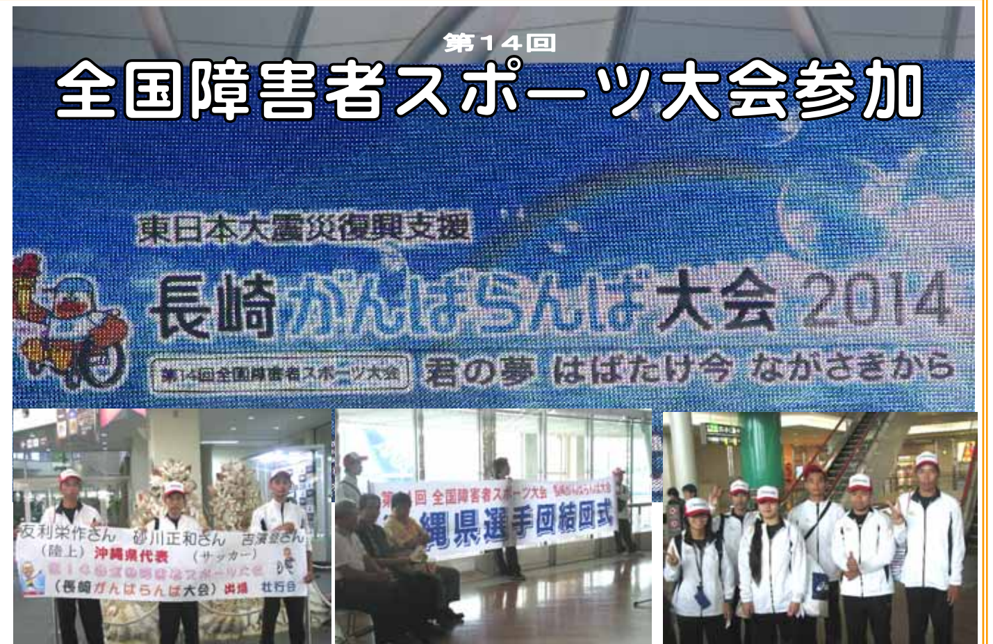
「宮古空港で出発式」