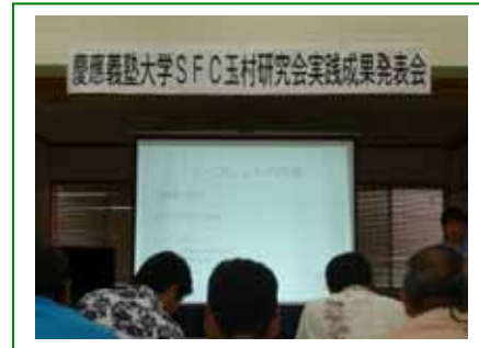
リーフレット紹介