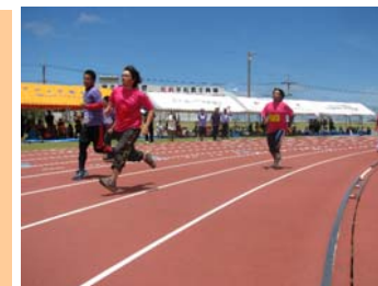
「トラック競技の花」がんばれ