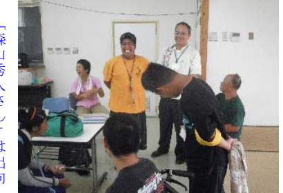
「実習を終えてみやこ学園利用者との交流会」