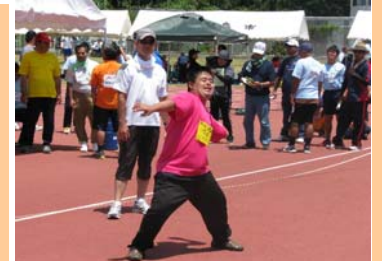
「基さん!」気合入ってます「ナイスポーズ」