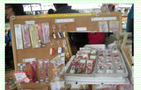
多種多様な手工芸品も人気でした。