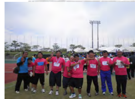
「みんなメダル取るぞ〜！」

11月3日(土)に開催された第21回沖縄県ゆーあいスポーツ大会に参加しました。前日は少し天気が悪くなり心配されましたが、当日は天気も回復し、晴天の空の下で各種競技に元気に参加しました。今回みやこ福祉会から過去最多の利用者の皆さんの参加があり、保護者の方々のボランティア参加にも助けられ2泊3日の日程をけが人もなく無事に楽しく過ごすことが出来ました。大会においては、メダルを取ったうれしさで満面の笑みを浮かべながら報告する方やあと一歩のところまでメダルを取れず悔しがる方など様々な表情がありました。夜はバイクングに行ったり、カラオケを歌いながらリズムカルに踊りだしたりと、各々のスタイルで楽しんでいました。競技終了後の最終日は沖縄美ら海水族館でオキちゃんショーやジンベイザメ、色とりどりの魚たちを見て楽しみ、そして今回初めて試みたのが琉球ガラス村でのコップ作りを体験しました。後日焼きあがった作品が届くと皆さん「きれいだね〜」「上等だね」と言いながら感激していました。一人ひとり充実した表情が見られた皆さんの思い出が出来たことと思います。ご協力頂いたスタッフの皆さんお疲れ様でした。