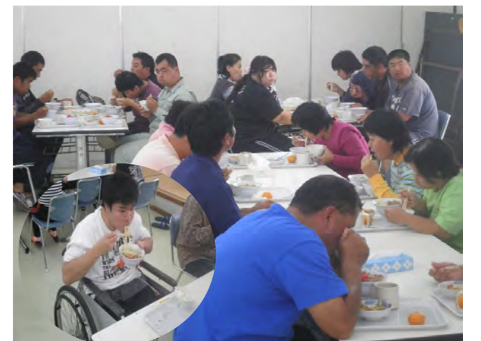
みやこ学園食堂にて「ごちそうさまでした」

毎年、製麺協同組合さんからはおそばの寄贈があり、この季節になると心待ちにしています。ご厚意に感謝申し上げますと共に来年も楽しみにしています。ありがとうございました。