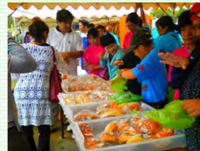
アダナス「パン」売れ筋No1

アダナスのパンの袋詰めでは保護者の皆さんの協力を頂き大変助かりました。ありがとうございました。来年の産業まつりでは更により良い商品を準備してお待ちしております。