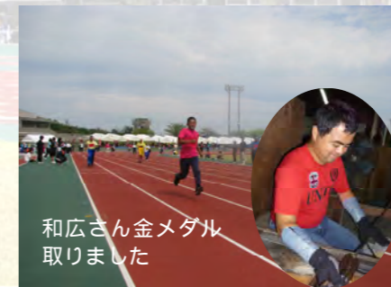
和広さん金メダル取りました