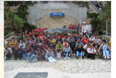
「沖縄美ら海水族館」全員で