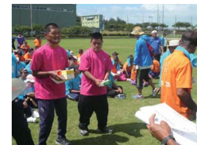
お二人さん頑張ったね