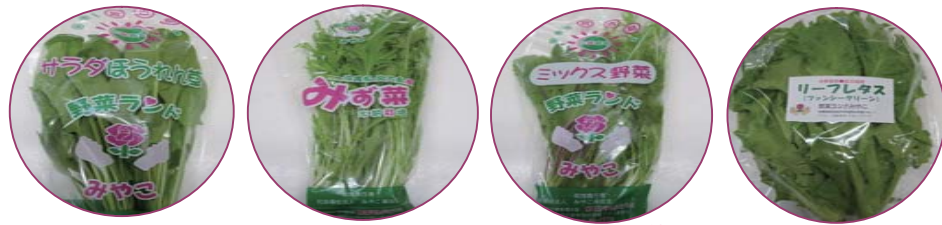
《ほうれん草》 《みずな》 《ミックス野菜》 《リーフレタス》