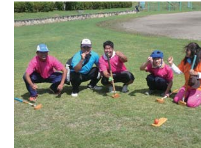
長浜チーム「エイエイオー」