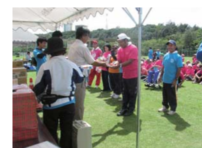
裕斗さんおめでとう