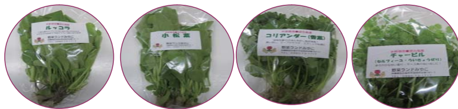
《ルッコラ》 《小松菜》 《コリアンダー》 《チャービル》

知ってましたか？水耕栽培のリーフレタスは普通の玉レタスより柔らかいんです。だから食べやすい。お子様、年配の方にも優しいレタスです。スープ、みそ汁に入れても炒めてもお使いいただけます。