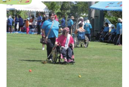
麻衣さんのボールどっち?